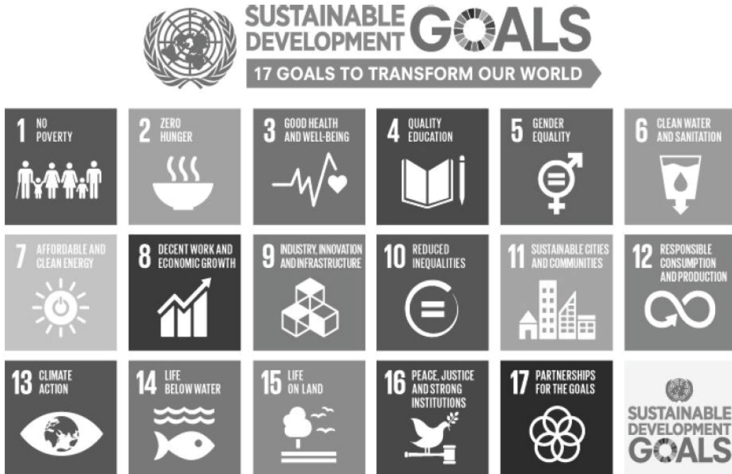
Rajah 1: Sustainable Development Goals

Setelah tamatnya MDG pada tahun 2015, PBB sekali lagi telah memperkenalkan sebuah dokumen jangka panjang bertempoh 15 tahun (dari tahun 2015 hingga tahun 2030) yang dikenali sebagai “Transforming Our World: The 2030 Global Agenda for Sustainable Development” . Dokumen ini telah disepakati oleh kebanyakan negara di dunia termasuklah Malaysia. Di dalam dokumen tersebut, terdapat 17 matlamat yang dikenali sebagai “Sustainable Development Goals” (SDG) dengan memfokuskan isu penting pembangunan global yang merangkumi aspek manusia, alam sekitar dan ekonomi. Senarai 17 matlamat SDG diringkaskan seperti dalam Rajah 1 di bawah.